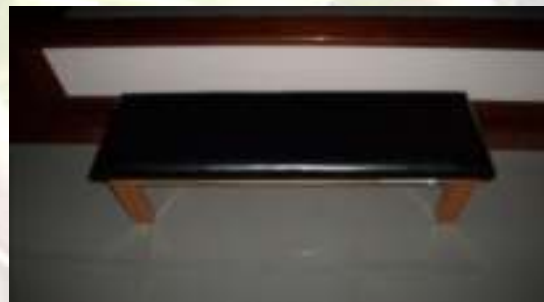
Banco de trabalho